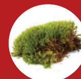
Algen und Moos